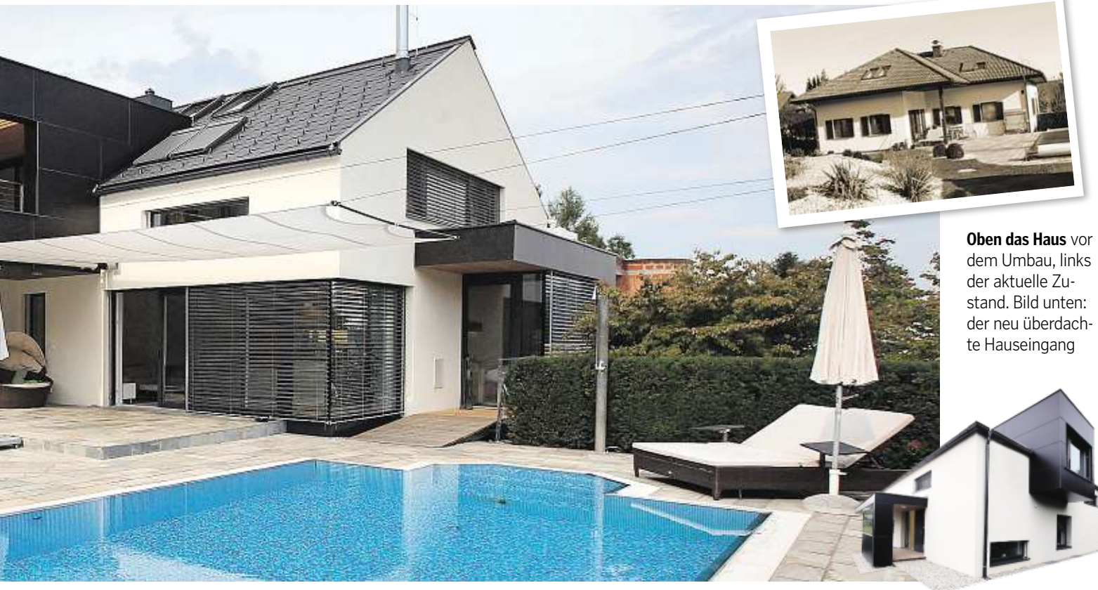
Oben das Haus vor dem Umbau, links der aktuelle Zustand. Bild unten: der neu überdachte Hauseingang