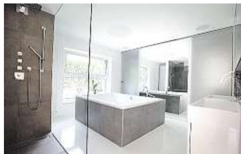
Das Bad im Erdgeschoss ist jetzt dort, wo früher die Küche war. Im Obergeschoss die Wohnung des Sohnes – und die neue „Wohnzimmerterrasse“